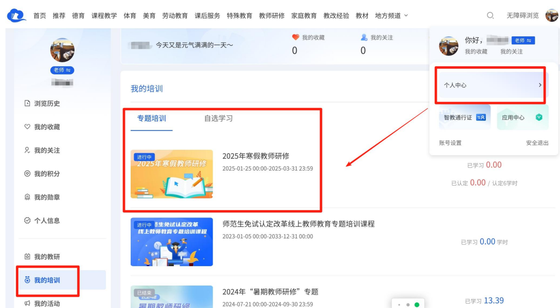
图 8 网页端从个人中心进入学习

问国家中小学智慧教育平台（basic.smartedu.cn），登录后，如图 8 点击右上角头像进入“个人中心”-“我的培训”-“专题培训”-“2025 年寒假教师研修”专题，点击相关课程进行学习。或登录智慧中小学 APP/桌面端，如图 9，在“工作台”中下拉到底，在“培训”中点击“专题培训”下方的“查看更多”进入专题培训页，点击“2025 年寒假教师研修”进入专题页学习。