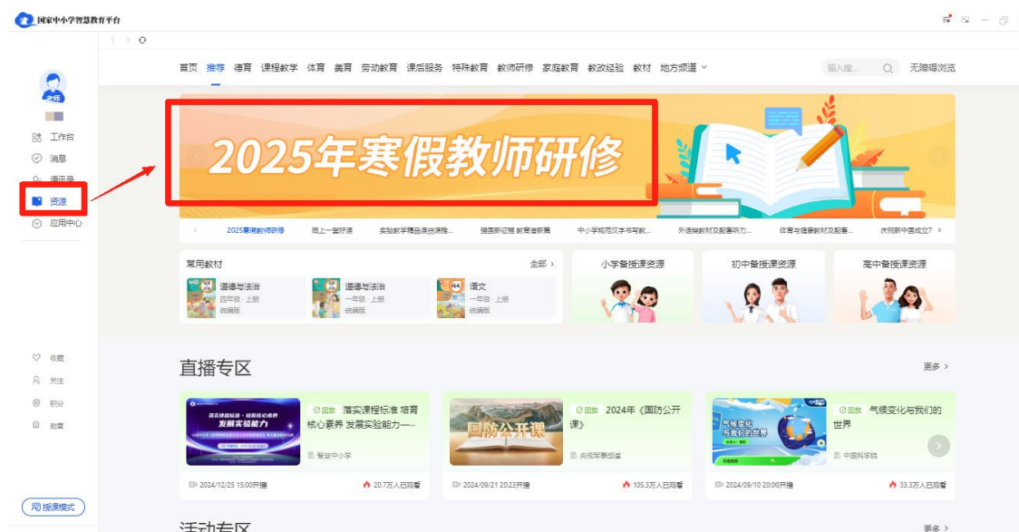
图 7 从桌面端进入专题页

打开软件后，首先进行个人账号登录。登录后，点击桌面端左侧“资源”栏，然后在首页轮播图中点击“2025 年寒假教师研修”进入专题页。点击“立即报名”即可开始学习。